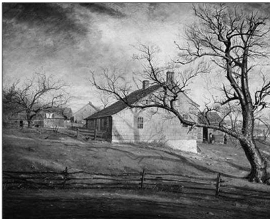
W.S. Mount, Long Islands Farmhouses

Na podstawie ilustracji wykonaj zadanie 7.